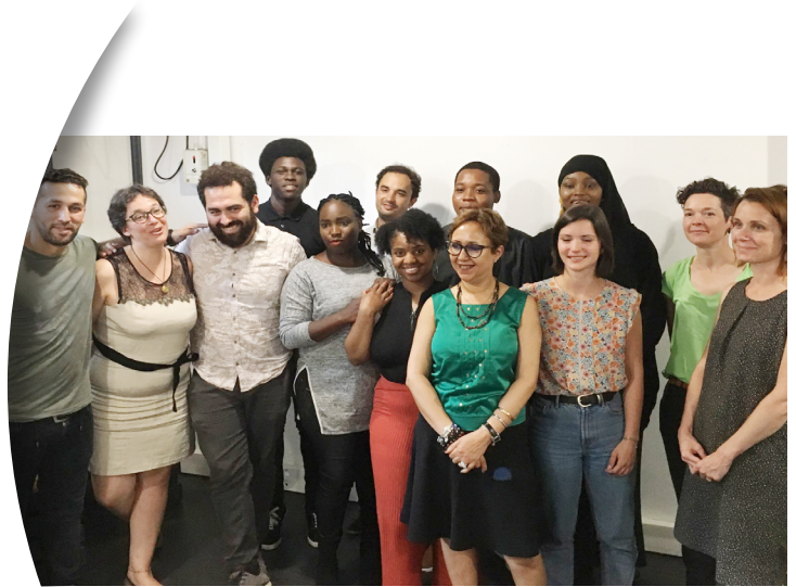
Coopérative Jeunes Majeurs Est Val d'Oise, Juin 2019

Les Coopératives d'Activités et d'Emploi (CAE) réunissent des professionnels autonomes, et permettent aux créateurs qui les rejoignent de travailler à leur propre rythme. Ils bénéficient d'une protection sociale, d'un appui individuel et collectif (sous forme d'ateliers et de formations). Lorsqu'ils dégagent du chiffre d'affaires, les professionnels autonomes deviennent entrepreneurs-salariés en CDI. Certaines CAE sont implantées spécifiquement pour les entrepreneurs de QPV à l'image de Port Parallèle dans la seconde couronne nord de la région parisienne.